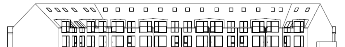
Facade mod haven