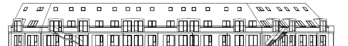
Facade mod Amtsvejen